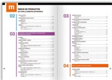
Índice de áreas y producto