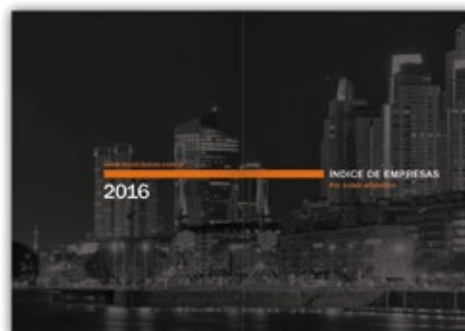
Doble página para presentar cada área