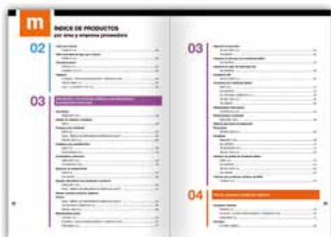
Índice de áreas y producto