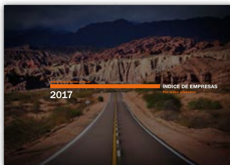
Doble página para presentar cada área